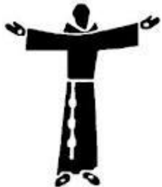
St. Franciscus van Assisi - 4 oktober