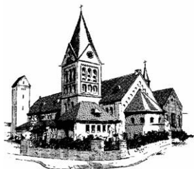
ST. MARTINUS WELTEN - BENZENRADE